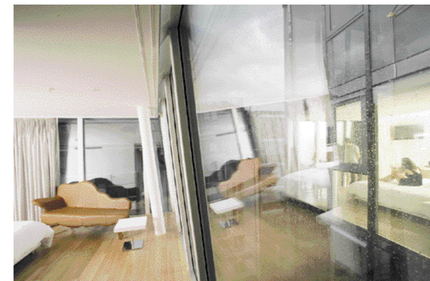
3 → 2-3 Hotelzimmer: